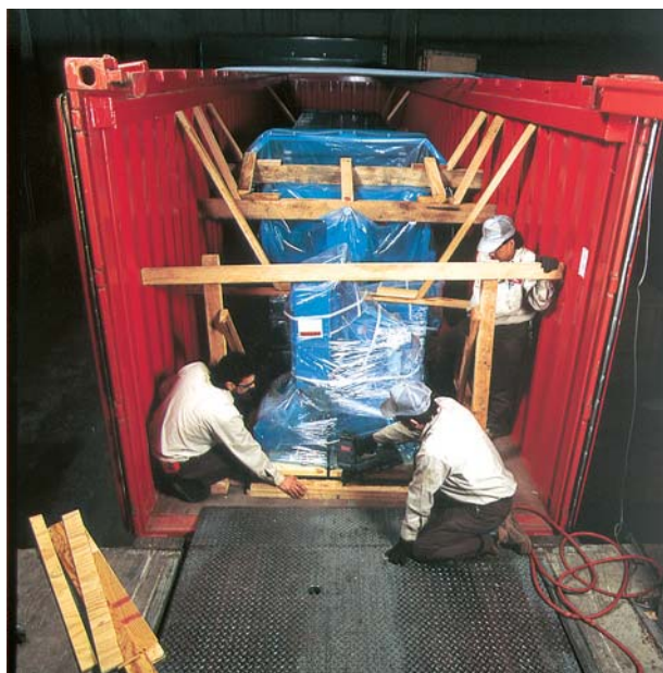
Ochrana velkých strojů není problém ani při zámořské přepravě

Bližší informace o využití VpCI inhibitorů Cortec i o možnostech úspor a snížení výrobních nákladů při jejich aplikaci pomohou řešit odborníci firmy TART, s.r.o., Vinohradská 91, Brno. Další údaje lze nalézt také na webových stránkách www.tart.cz nebo www.cortecvci.com .