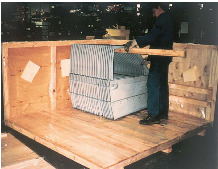
V uzavřeném prostoru postačí několik emitorů VpCI

ochrany proti korozi je to jedna z nejdůležitějších výhod. Touto cestou lze eliminovat mnoho nadbytečných provozních kroků, jako čištění, odmašťování, odstraňování rzi, moření, pískování a používání dalších operací. Odstraní se tak nadbytečné práce, zlepšuje se kvalita, sníží počet reklamací z důvodu koroze a prodlouží se životnost výrobků a zařízení. Produkty CORTEC umožňují efektivní, ekonomická dávkování, se kterými je možno ošetřit i výrobky, které se jinak velmi obtížně chrání. Ochrannou vrstvu VpCI inhibitorů není třeba žádným způsobem odstraňovat. Před zpracováním, instalací nebo použitím odpadají nepříjemné pracovní úkony jako odmaštění, seškrabání, čištění či jiné způsoby úpravy. Případnou těsnící ochrannou vrstvu lze odstranit běžnými čisticími prostředky.