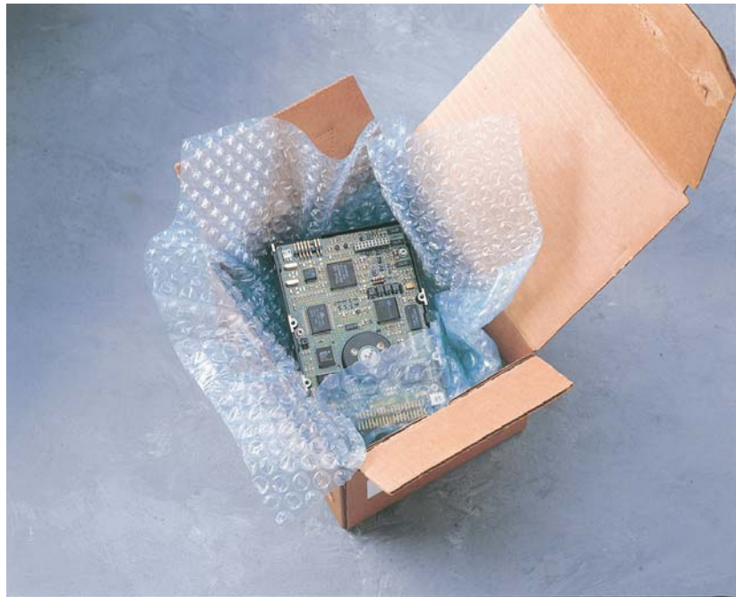
Bublínková fólie Cortec 126 VpCI zajišťuje mechanickou i antikorozi ochranu výrobku

Strojírenská výroba je v poslední době postavena před zdánlivě neřešitelné dilema. Na jedné straně stojí striktní požadavky odběratelů na maximální kvalitu a spolehlivost vyráběných zařízení, součástí a celků. Na druhé straně působí mimořádně silný tlak konkurenčního prostředí globálního trhu, který snižuje konečné prodejní ceny na minimum. Je to úkol hodný chytré horákyne – nabídnout výrobky lepší a přitom levnější.