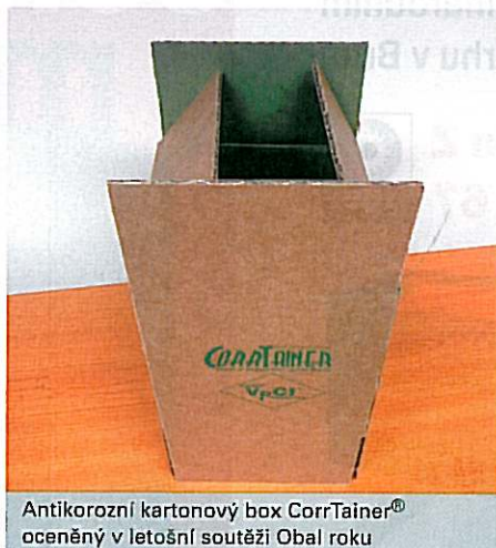
Antikorozi kartonový box CortecTainer® oceněný v letošní soutěži Obal roku